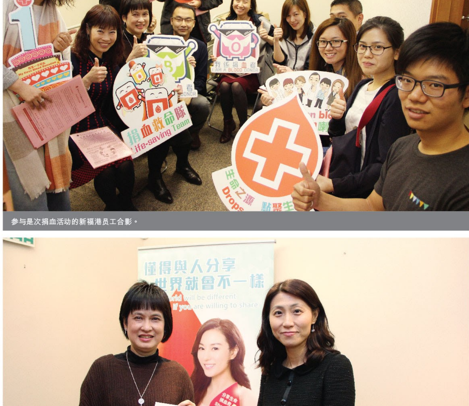
参与是次捐血活动的新福港员工合影。

为响应香港红十字会的呼吁，鼓励员工加入捐血行列，并让员工明白「捐血救人、人人有责」，新福港于2017年3月29日组织员工参与红十字会的捐血活动，鼓励员工亲身体会助人的乐趣。