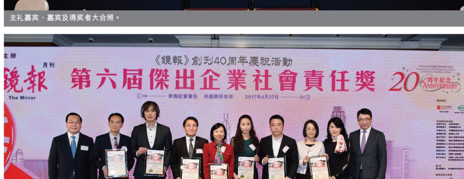
主礼嘉宾、嘉宾及得奖者大合照。

凭著杰出的社会责任表现，新福港集团连续第六年荣获《镜报》月刊颁发「杰出企业社会责任奖」，足以肯定集团在社会责任的贡献。是次颁奖典礼于本年度3月27日假金钟JW万豪酒店宴会厅举行，并再次邀得香港特别行政区行政长官梁振英先生担任主礼嘉宾。