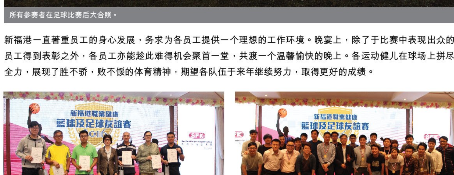
所有参赛者在足球比赛后大合照。

新福港一直著重员工的身心发展，务求为各员工提供一个理想的工作环境。晚宴上，除了于比赛中表现出众的员工得到表彰之外，各员工亦能趁此难得机会聚首一堂，共渡一个温馨愉快的晚上。各运动健儿在球场上拼尽全力，展现了胜不骄，败不馁的体育精神，期望各队伍于来年继续努力，取得更好的成绩。